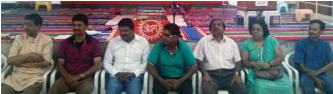
August 2014 Birthdays