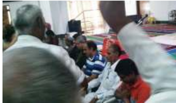
July 2014 Birthdays