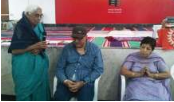
June 2014 Birthdays

On the last sunday of every month, Arya Samaj Indiranagar celebrates and honours its members and their families whose birthday falls during the month. Below are the views from the same.